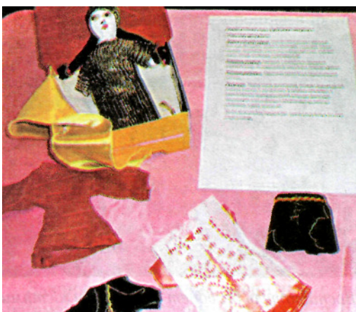
Кукла-закрутка и ее костюм