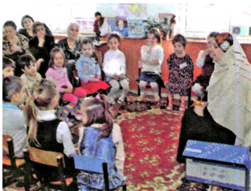
Воспитатель беседует с детьми и гостями

Проводится пальчиковая гимнастика. Звучит национальная музыка, дети самостоятельно конструируют кукол.