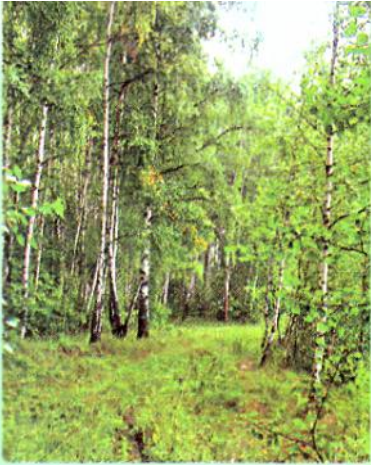
Слайд 5. Лес