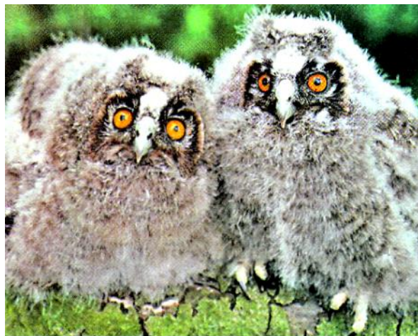
Слайд 4. Совята