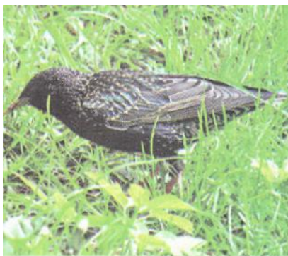
Слайд 9. Скворец