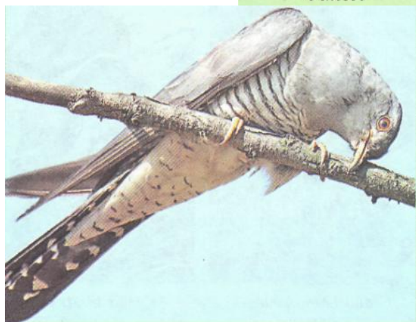
Слайд 6. Кукушка