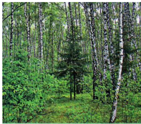
Слайд 2. Лес