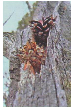
Слайд 12. «Кузница» дятла