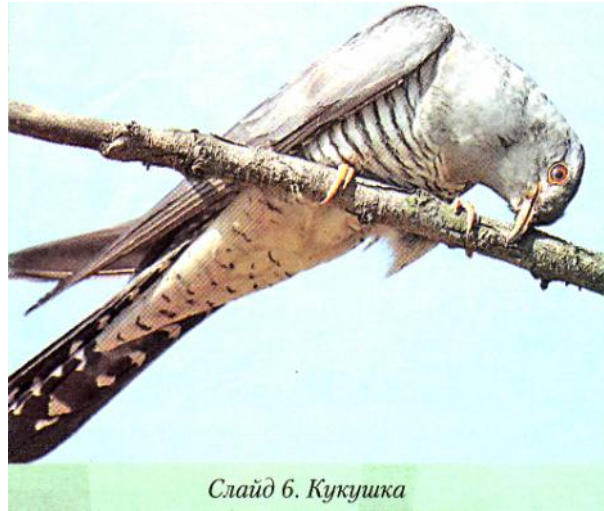
Слайд 6. Кукушка