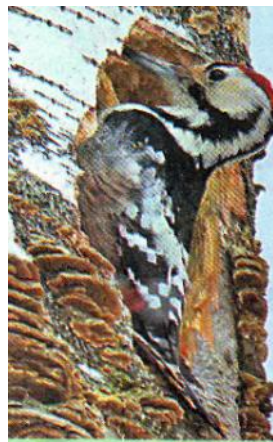
Слайд 13. Дятел