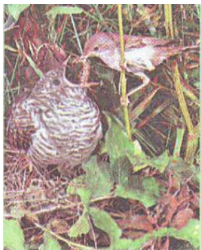
Слайд 8. Кукушонок в гнезде