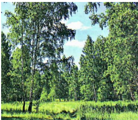
Слайд 1. Опушка леса