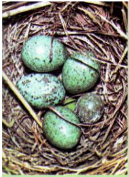
Слайд 7. Гнездо с яйцом кукушки