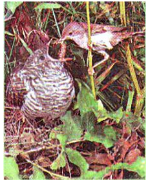
Слайд 8. Кукушонок в гнезде