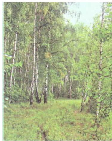
Слайд 5. Лес