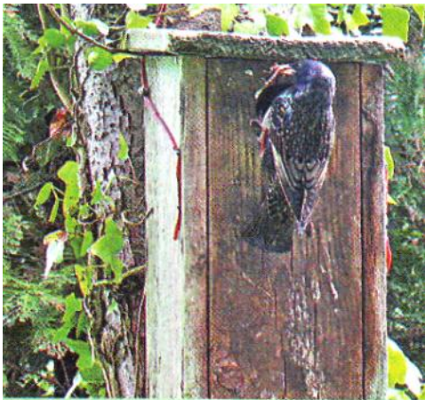
Слайд 10. Скворечник