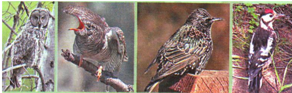
Слайд 15. Отгадки