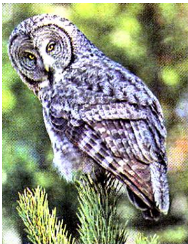
Слайд 3. Сова