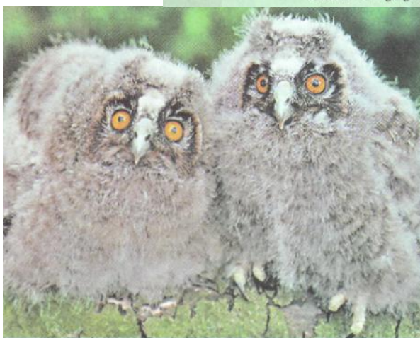
Слайд 4. Совята