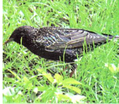
Слайд 9. Скворец