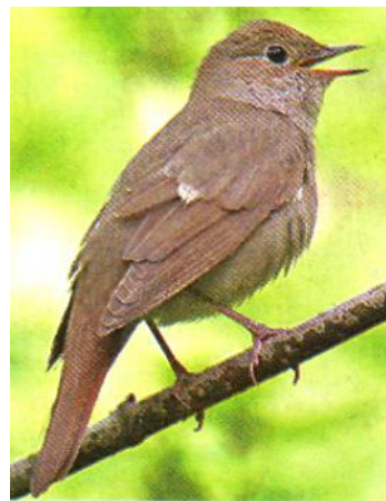
Слайд 14. Соловей