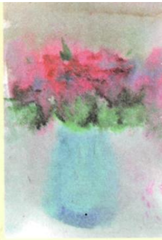
Рис. 4. Работа Тимофея, 4 года 6 месяцев

В нижней части листа гуашью рисуется ваза. На кисть наносят сразу два цвета: сначала светлый оттенок, потом любой, по выбору каждого ребенка. Далее выбирается местоположение вазы и с помощью формирующих движений создается силуэт вазы. Форма вазы может быть любой. Все зависит от того, как расположены цветы в натюрморте.