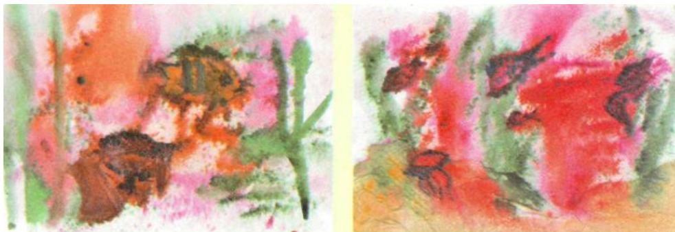
Иоанна, 4 года 6 месяцев

На подсохший фон рыбок прикрепляют с помощью двустороннего скотча. Водоросли можно изобразить с помощью зубной щетки, пастели или пластилина. Дно также может быть дополнено деталями (ракушки, камни, бусинки), которые закрепляются на фоне пластилином. Некоторые камни по желанию детей могут быть окрашены гуашью (см. рис. 8).