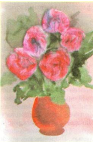
Рис. 5. Работа Алены, 6 лет 3 месяца

Вазу можно нарисовать гуашью приемом механического смешивания цветов или поролоновыми тампончиками (поролоновые губки, намотанные на карандаш). Поролон придает вазе дополнительную фактуру.