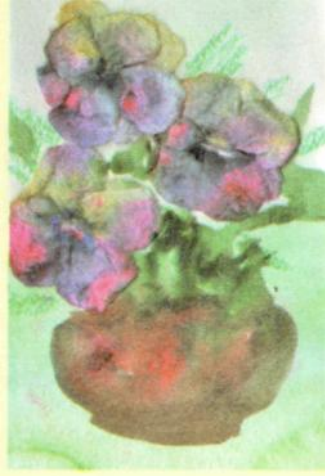
Рис. 6. Работа Саши, 6 лет

складывают салфетку еще два раза. После этого ножницами вырезают один лепесток. Бутон раскрывают и посыпают пищевыми красителями (желтый, синий и фиолетовый). А лепестки смачивают водой с помощью кисточки. Красители растекаются, окрашивая бутоны.