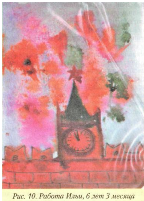
Рис. 10. Работа Ильи, 6 лет 3 месяца

Техника, которая также создает эффект распыления, - это рисование сухой гуашью . Как ее применить в работе с детьми, сохраняя изобразительные возможности? Прежде всего следует размельчить гуашь до порошкового состояния. В таком виде она легче, но на влажный лист бумаги с помощью валика или губки. После этого сразу рассыпают сухую гуашь; так образуются цветные пятна, имитирующие бутоны. Сердцевинки цветов дорисовывают гуашью, тычинки наносят ватными палочками. Корзинку можно изобразить с помощью пластилина, применив прием раскатывания столбиков. Столбики укладываются друг за другом в горизонтальном положении; так передается