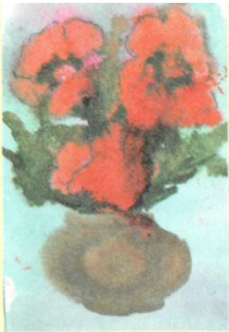
Рис. 3. Работа Кати, 5 лет 4 месяца