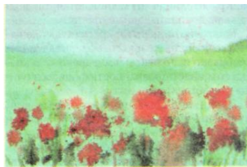
Рис. 2. Работа Дуни, 3 года 6 месяцев