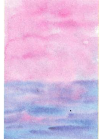
Рис. 7. Работа Сони, 3 года

Для морского пейзажа, так же как и для любой работы, фон подготавливают на основе акварельных красок. С помощью широкой кисти или поролонового валика распределяется цветовое пространство листа бумаги на небо и море. Цветовые выборы могут быть любыми. Самое главное - создать колорит-настроение. Для этого смешивают цвета на влажной основе листа бумаги, а затем сразу наносят пищевые красители для обозначения моря и облаков. Чтобы передать фактуру моря, красители рассыпают в форме полосок. Для изображения облаков (туч) лучше рассыпать красители пучками по кругу (см. рис. 7).