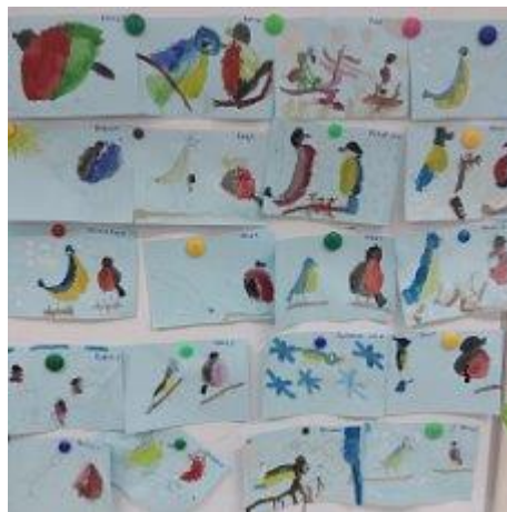
птицы – снегири - синицы