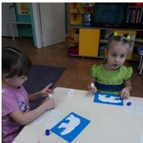
Аппликация «Белый медведь»