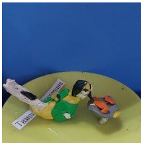
Лепка «Птичья столовая»